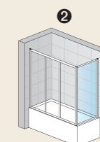
TOW3 + TOPV