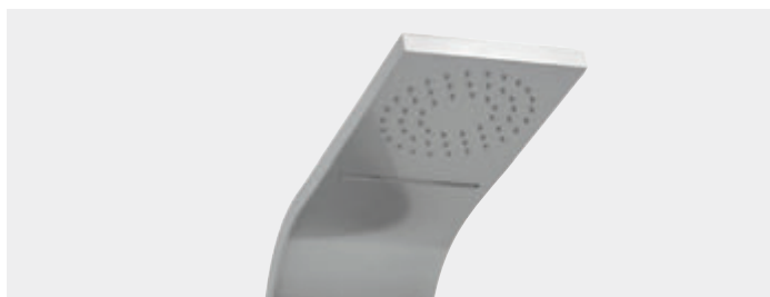
Pevná hlavová sprcha a vodopád