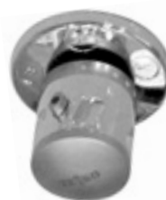
5 polohový přepínač