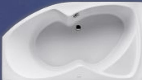
zobrazena levá varianta